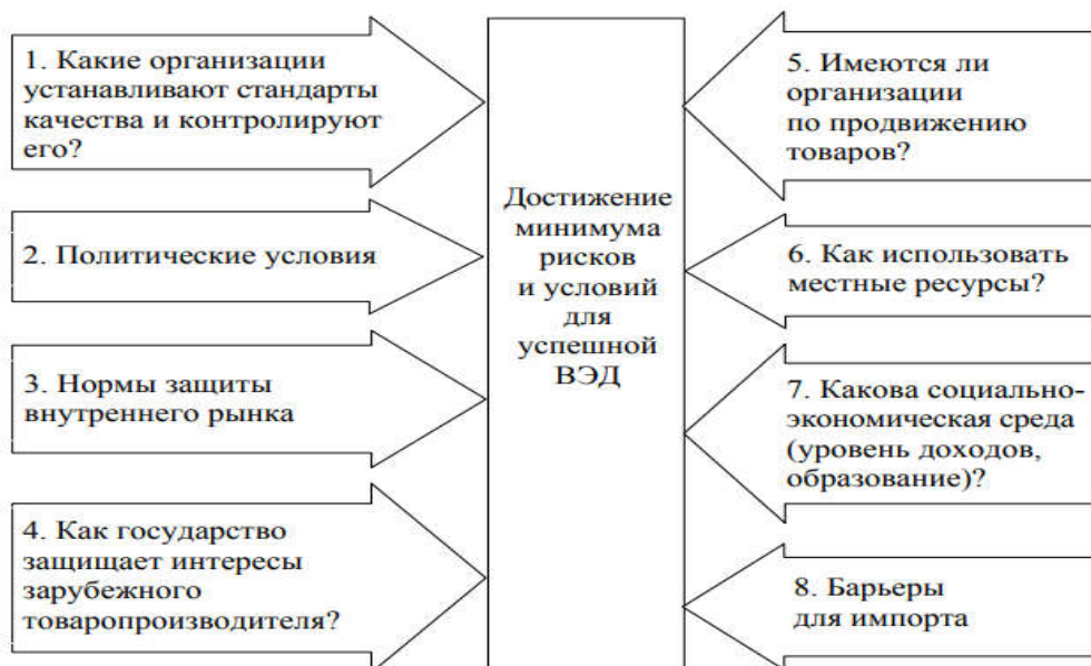
Рисунок А.1 – Вопросы, которые необходимо учитывать при выходе на внешние рынки при взаимодействии с территорией [9].