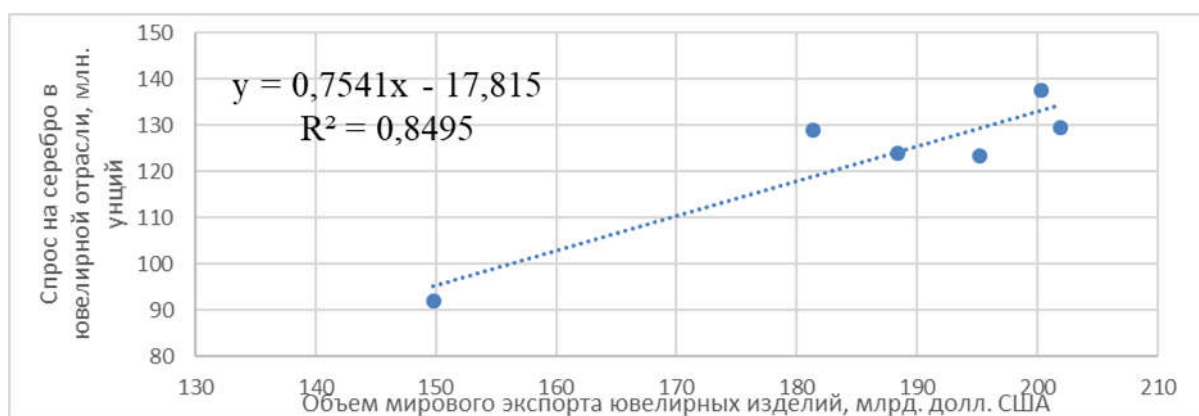
Рисунок 4.1 – Результаты корреляционно-регрессионного анализа

Рисунки используются в ВКР, когда нужно изобразить предмет таким, каким мы его воспринимаем зрительно, но без лишних деталей. Такие рисунки выполняются, как правило, в аксонометрической проекции, которая позволяет наиболее просто и доступно изобразить предмет.