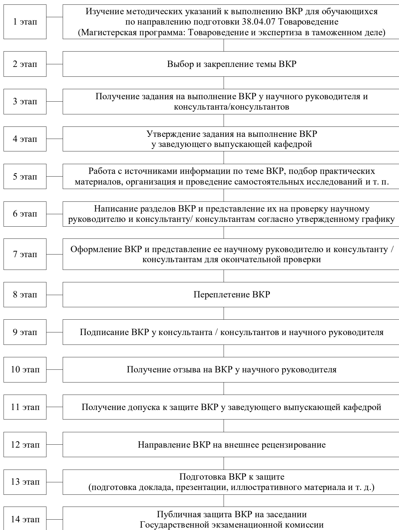
Рисунок 1 – Этапы выполнения выпускной квалификационной работы