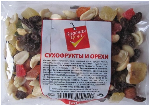
товар № 2