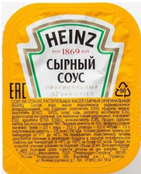
товар № 1

Задание 6. При помощи онлайн-сервиса «ТН ВЭД Онлайн» используя «поиск по наименованию товара» определить коды ТН ВЭД для товаров (изображение представлено ниже) и объяснить свой выбор: