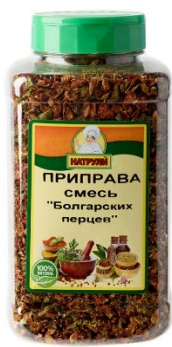
товар № 3

Во вкладке «Пояснения к ТН ВЭД» соотнести выбранный код товара с пояснениями для формирования индивидуального объяснения выбора код ТН ВЭД.