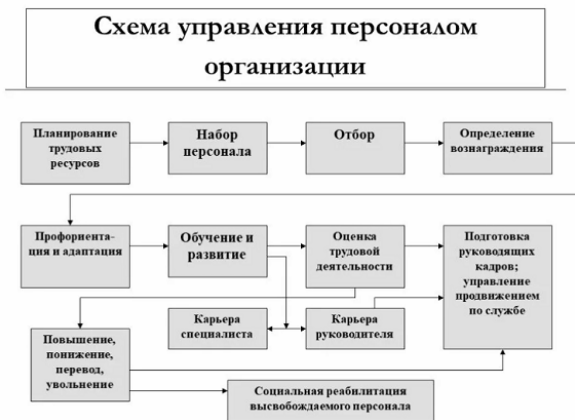
Рисунок 2.1 – Схема управления персоналом организации