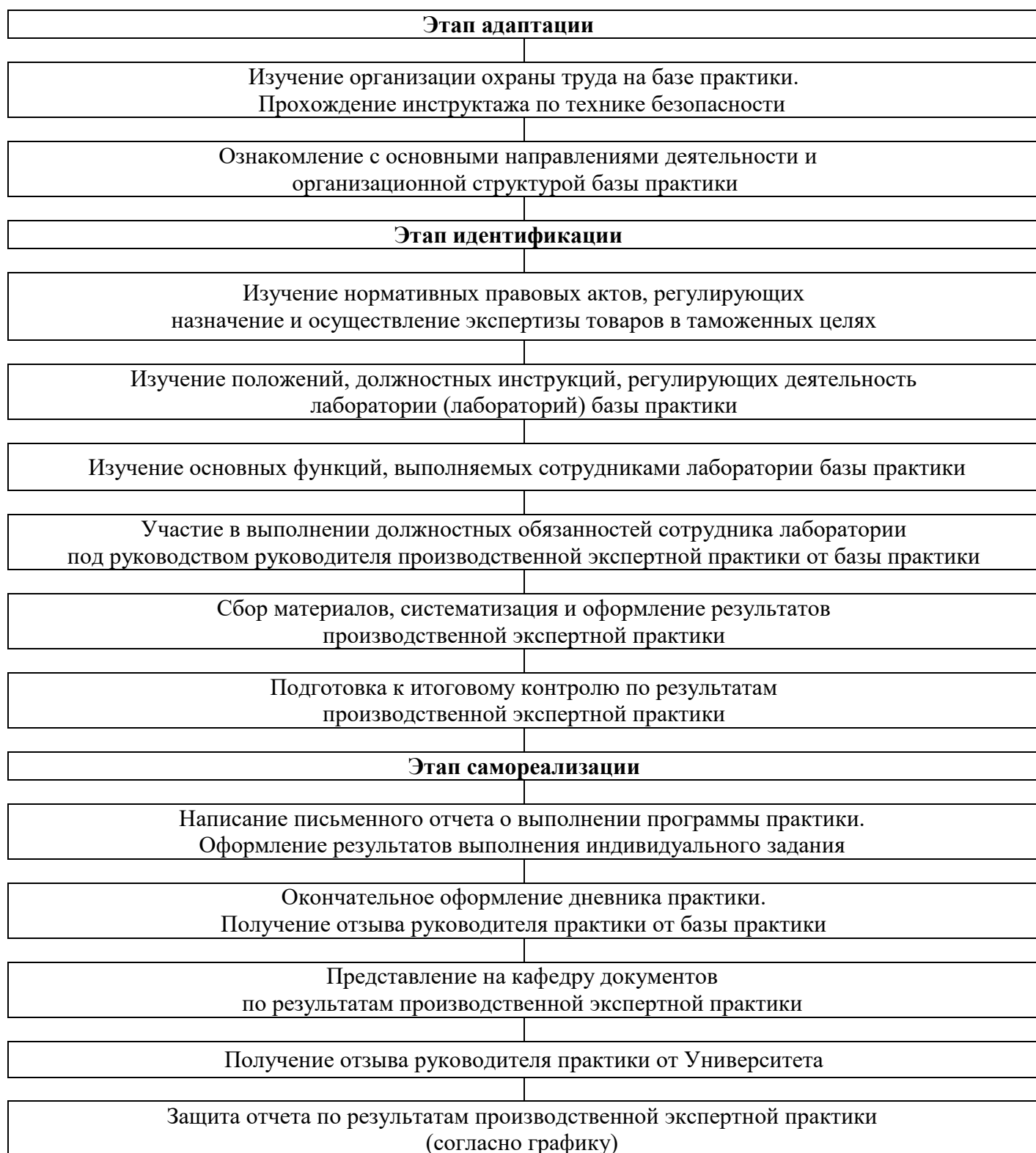
Рисунок 3.1 – Структурно-логическая схема прохождения производственной экспертной практики