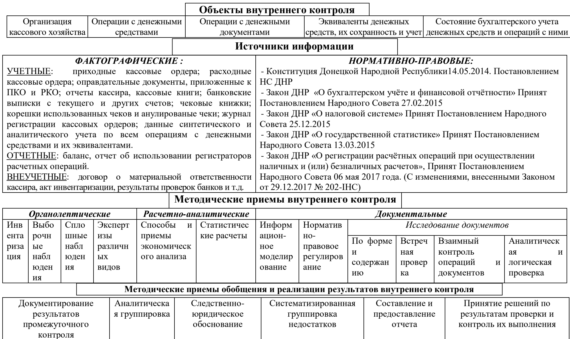
Рис. Организационная модель внутреннего контроля движения денежных средств организации