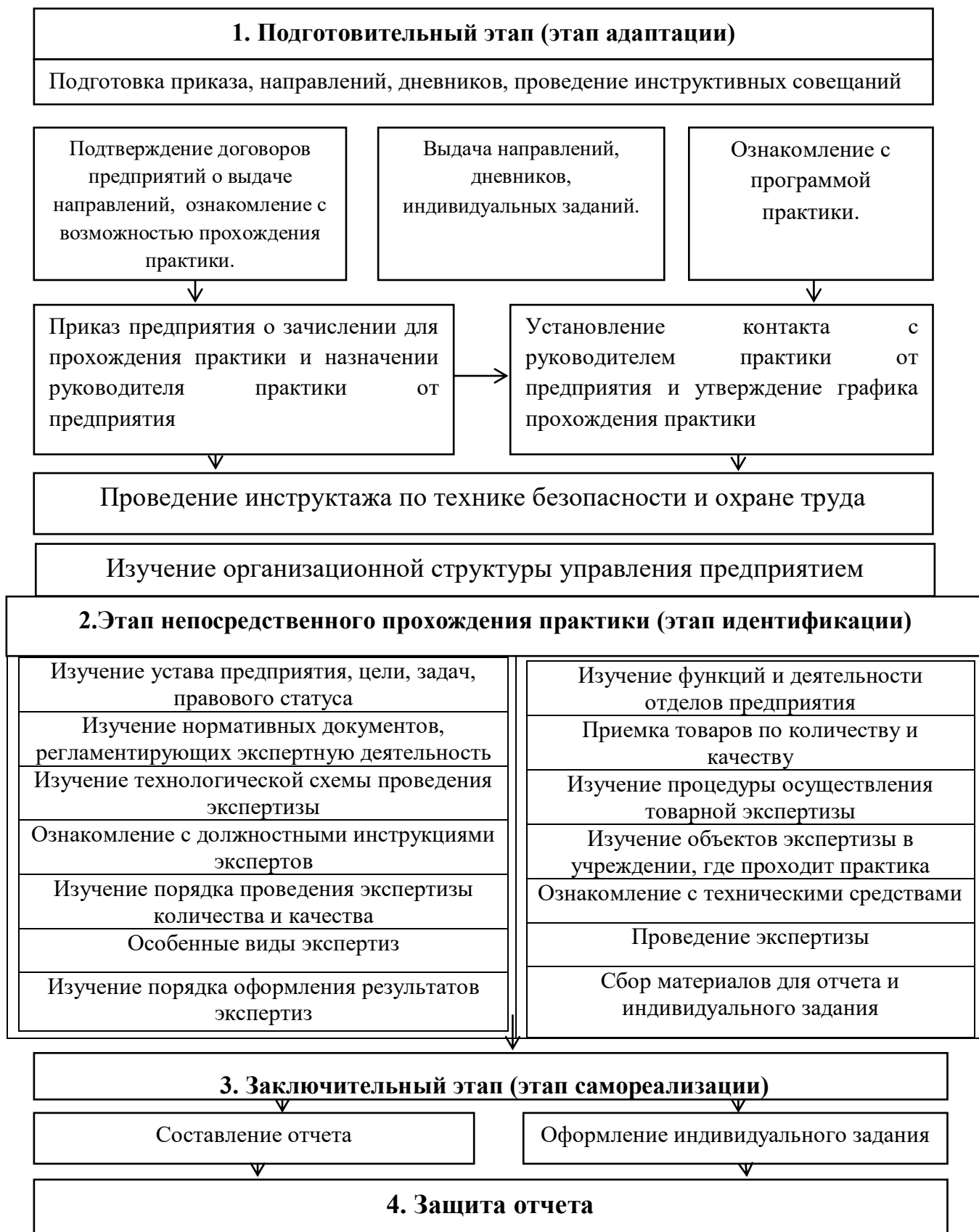
Рисунок 1 - Структурно-логическая схема прохождения производственной практики по экспертной деятельности студентами направления подготовки 38.04.07 Товароведение профиля Товароведение продовольственных товаров и коммерческая деятельность