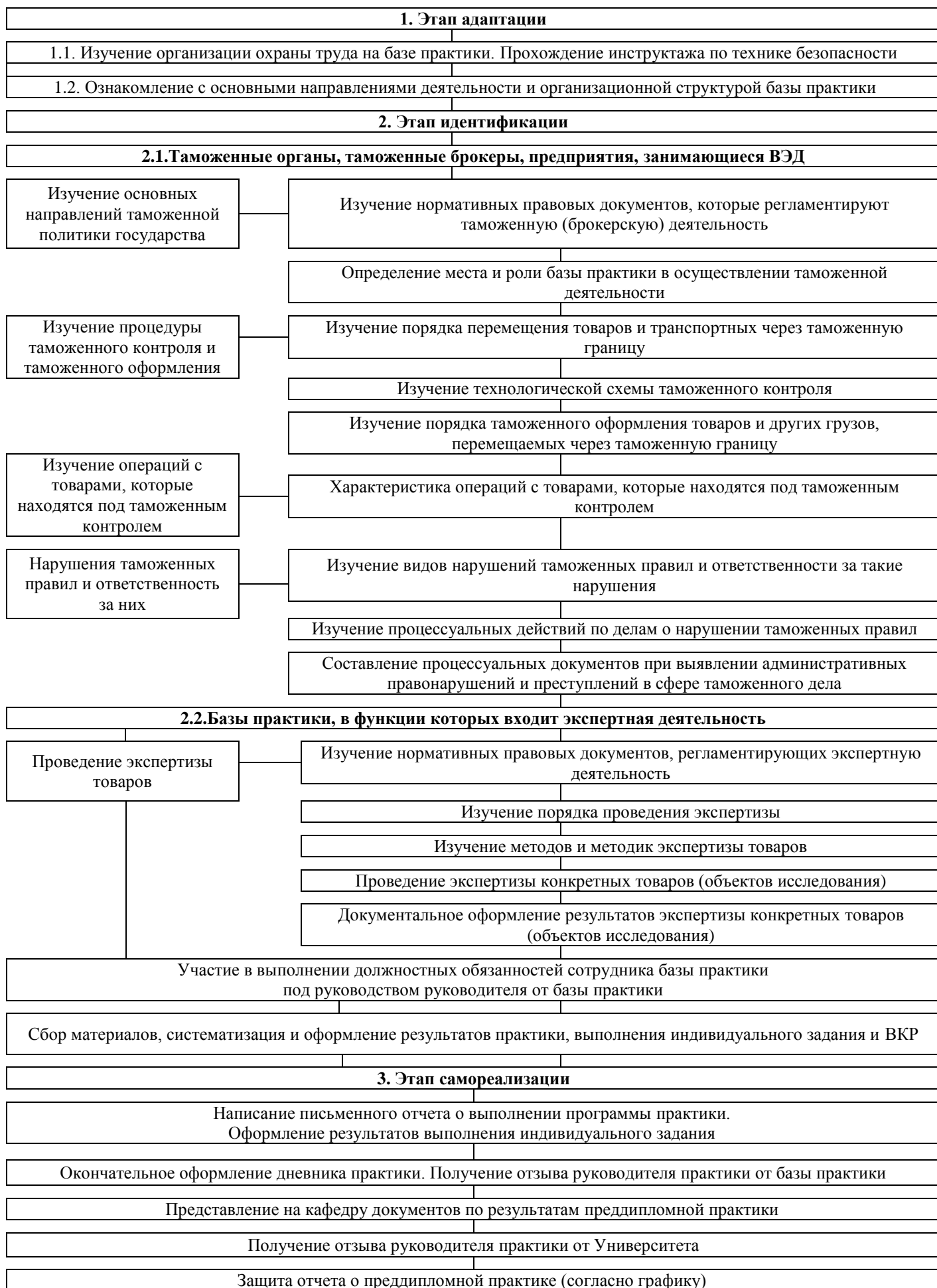
Рисунок 3.1 – Структурно-логическая схема прохождения практики