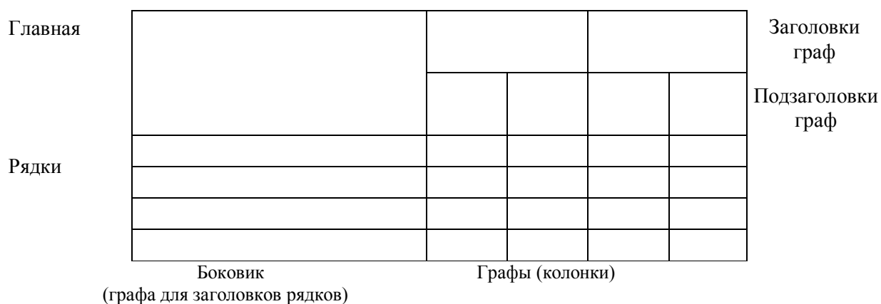
Рисунок 6.1 - Пример оформления таблиц

Показатели, которые размещаются в строках боковика, выравниваются по левому краю, показатели в графах (подграфах) - по центру.