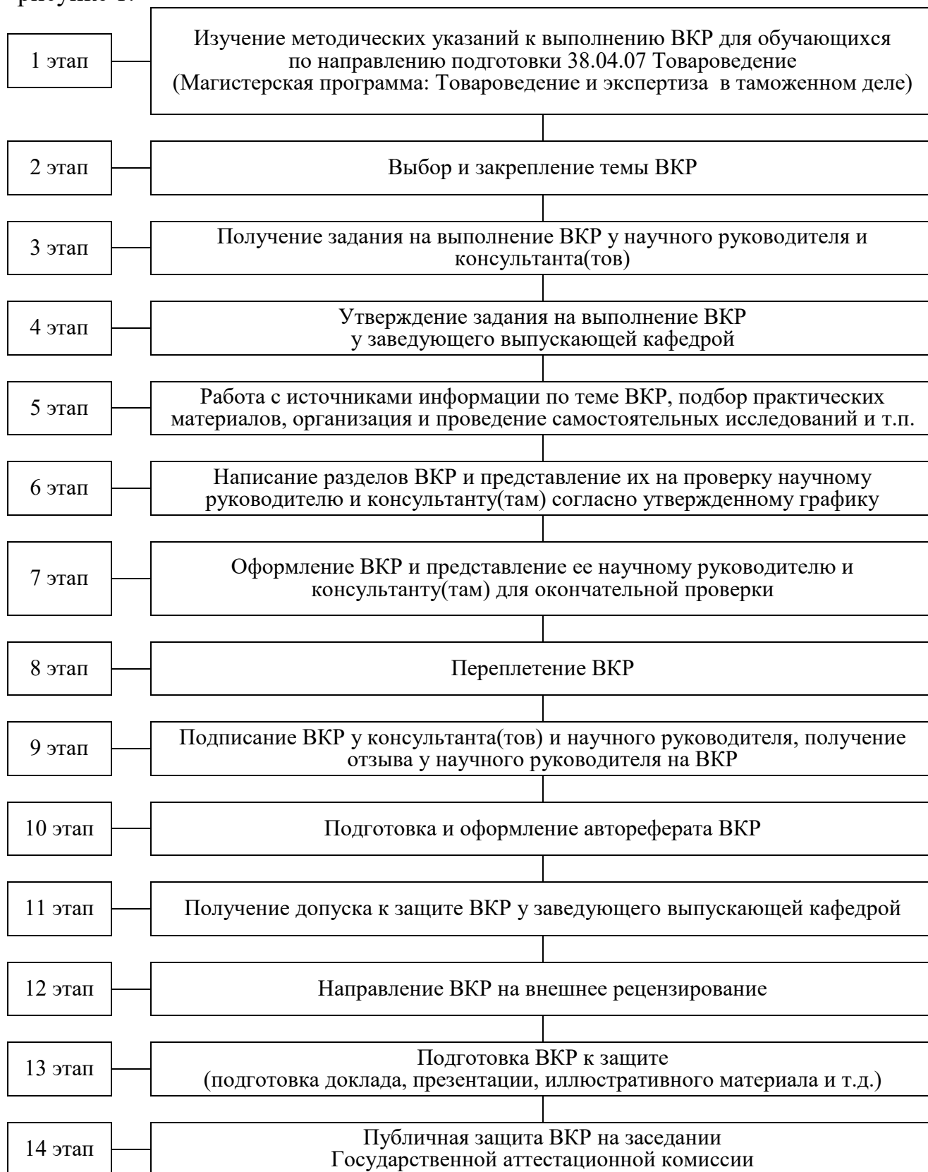
Рисунок 1 – Этапы выполнения ВКР

Выполнение ВКР рекомендуется разделить на этапы, приведенные на рисунке 1.