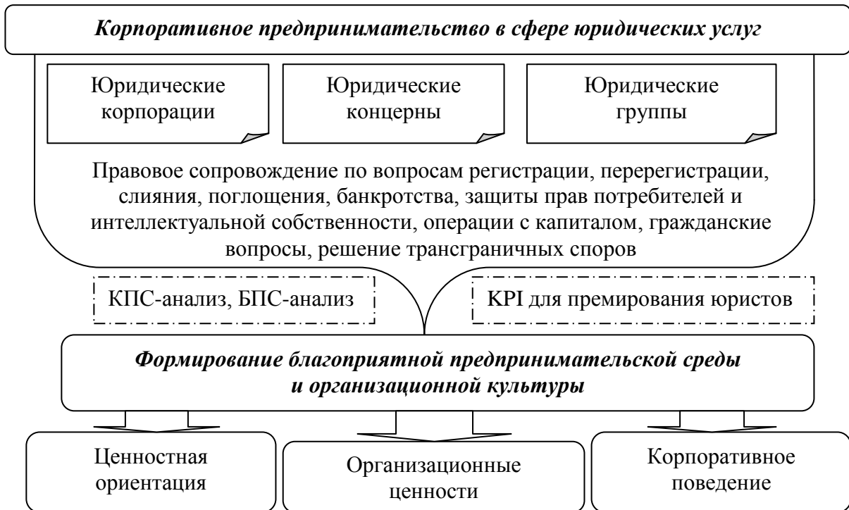
Рисунок 4 – Формирование благоприятной предпринимательской среды в развитии корпоративного предпринимательства

Для оценки и анализа благоприятной предпринимательской среды (БПС) выбраны 5 юридических компаний г. Донецка. Оценка факторов БПС проводится с использованием метода, который определяет эксперт исходя из специфики деятельности фирмы. Качественной оценкой будет считаться общая оценка всех факторов БПС (табл. 3).