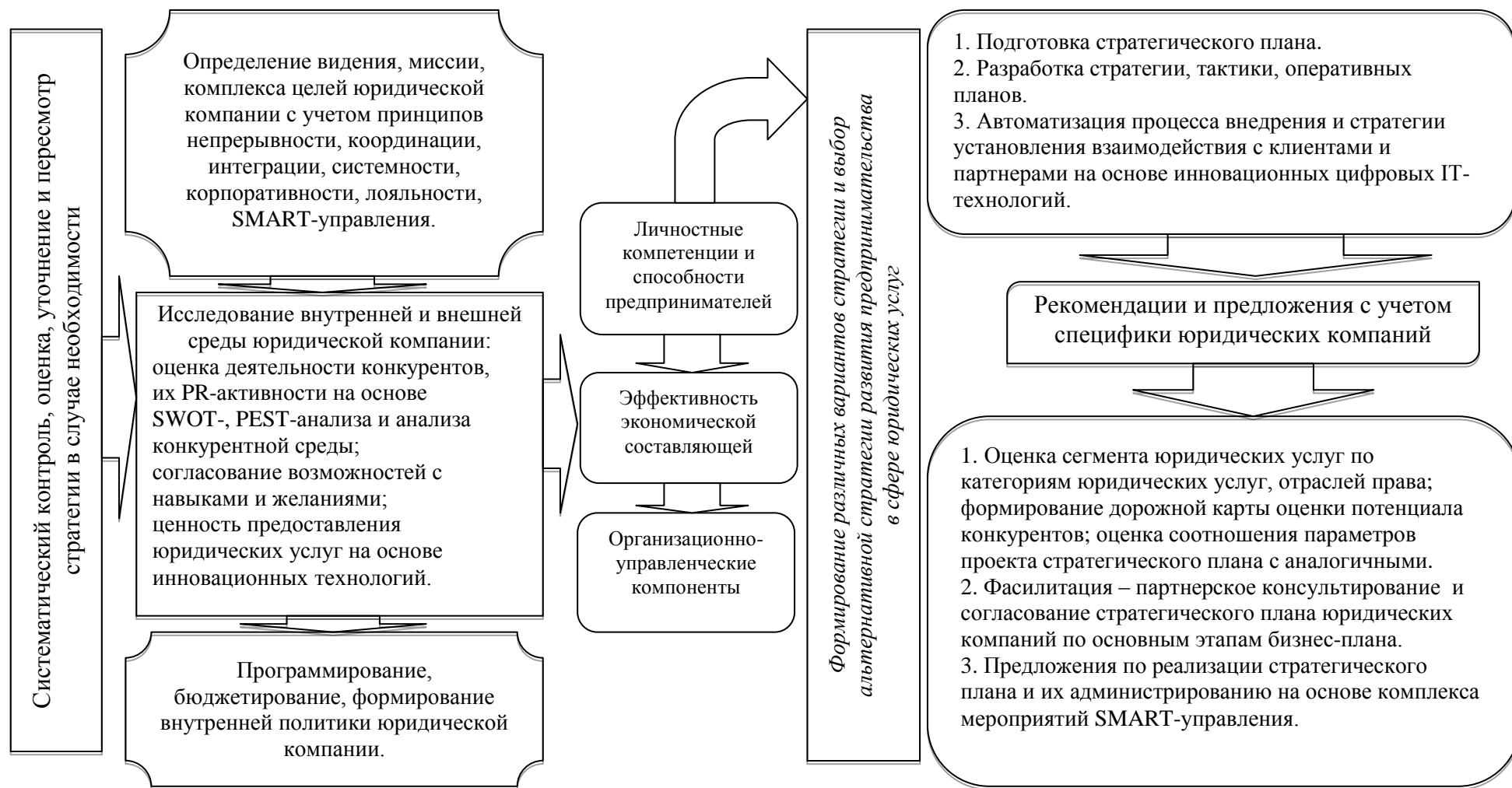
Рисунок 5 – Структурно-логическая схема формирования направлений стратегического планирования предпринимательской деятельности в сфере юридических услуг