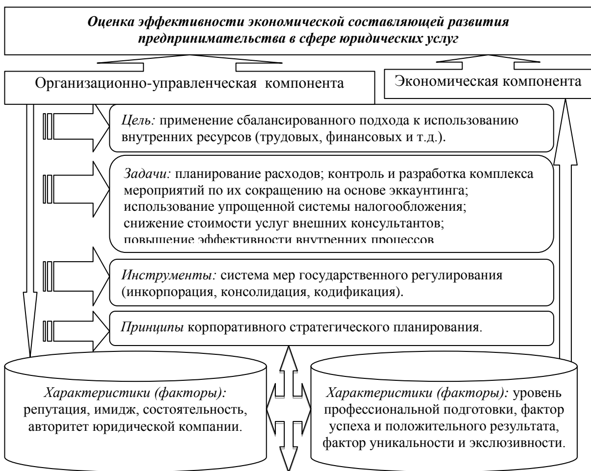
Рисунок 3 – Оценка эффективности экономической составляющей развития предпринимательства в сфере юридических услуг

Предложен научно-методический подход к оценке эффективности экономической составляющей развития предпринимательства в сфере юридических услуг на основе балльной оценки организационно-управленческого компонента в разрезе ситуационного изменения по шкале Лайкерта, оценка которого проводится согласно ключевым показателям степени эффективности и удовлетворенности респондентов качеством юридических услуг, и на основе оценки экономического компонента в результате расчета коэффициентов экономической эффективности с учетом объективности формирования показателей и весомости факторов эффективности (рис. 3).