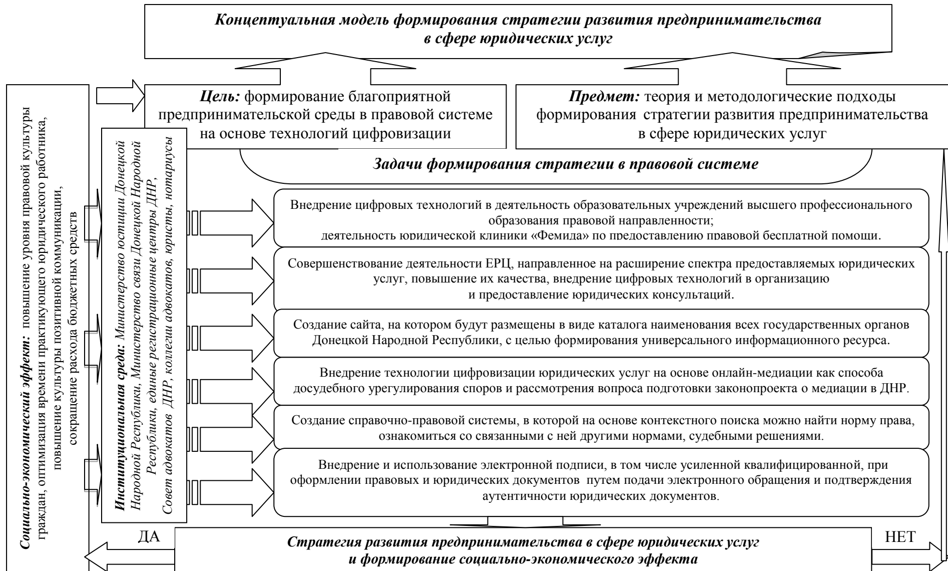
Рисунок 6 – Концептуальная модель формирования стратегии развития предпринимательства в сфере юридических услуг