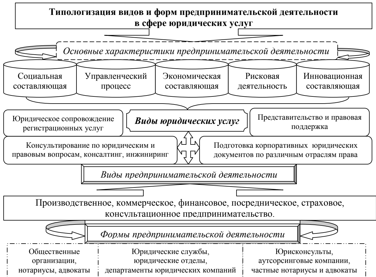
Рисунок 1 – Типологизация форм и видов предпринимательской деятельности в сфере юридических услуг

классификация форм и видов предпринимательской деятельности, что позволило выявить влияние характера деятельности и вида используемых факторов предпринимательства в сегменте юридических услуг и выделить среди видов предпринимательской деятельности консультационное предпринимательство, которое приобретает формы, систематизированные на рисунке 1.