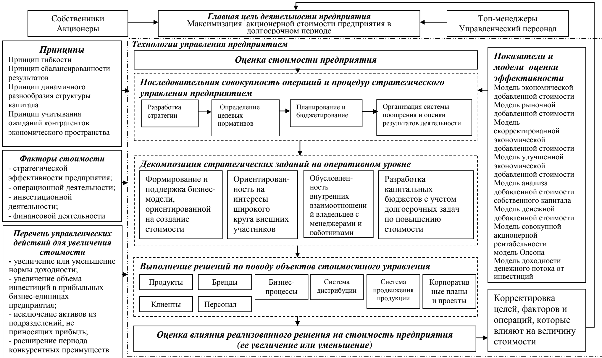
Рисунок 1 – Концептуальная схема технологий управления предприятием на основе стоимостного подхода (авторская разработка)