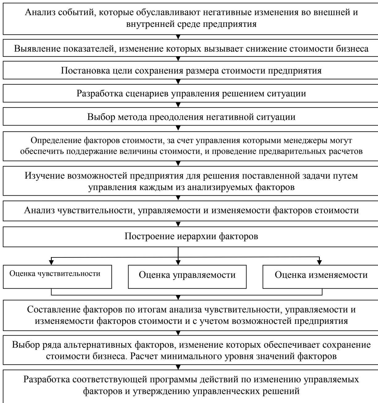
Рисунок 3 – Внедрение технологии управления стоимостью на основе ситуационного подхода (авторская разработка)

стоимостным показателям в качестве системы измерения эффективности деятельности предприятия.